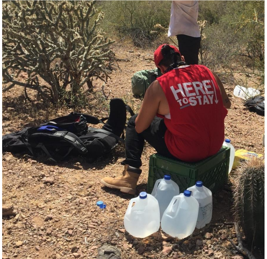
Voluntario con camiseta temática de DACA en un punto de provisión de agua en algún lugar en el corredor migratorio de Ajo en abril.

Después de la redada de junio, ustedes estuvieron a nuestro lado. Casi lograron duplicar la meta de $10 000 que nos habíamos fijado recaudar ese mes. Las solicitudes